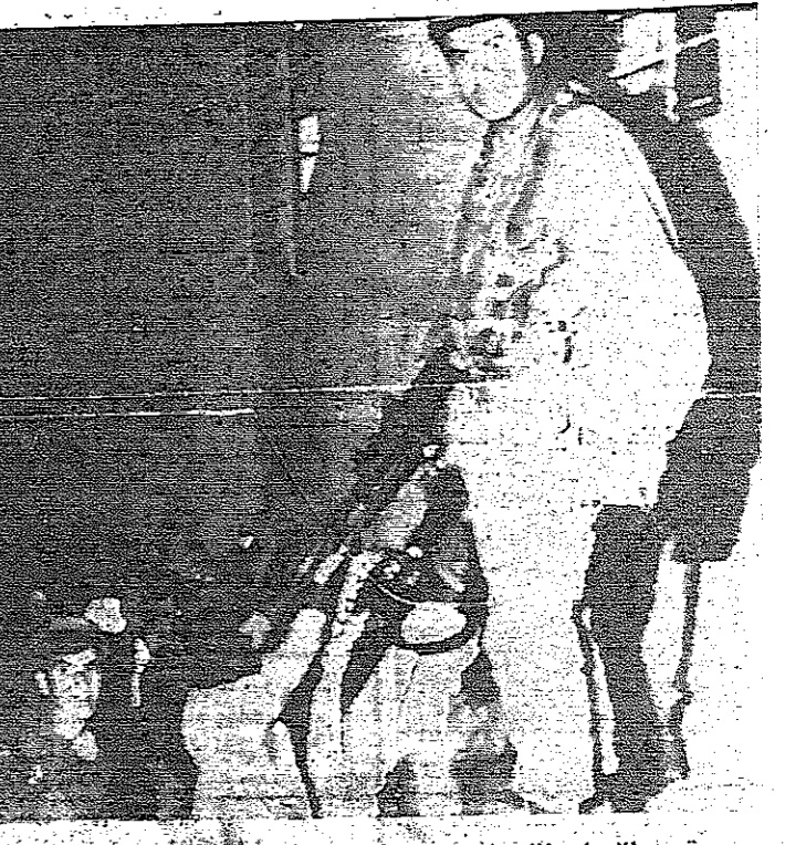
صورة من الإرهاب الذي فرضتها سلطات الاحتلال الإسرائيلي على مدينة الخليل . لقد اعتقل مئات من المواطنين العرب ووضعوا في مكان ضيق واحد في ظل بلباغ وحزب الخليل (صورة لاسكّة خاصة بالصورة لاسكّة من اليونانديرس خاصة بالدستور)